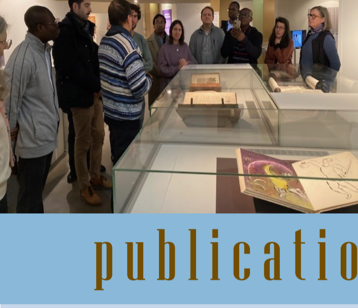
Photo prise lors de la visite, du 9 novembre, de l'exposition à la BNU « Sacrés Rois ! David & Salomon à travers les âges ».